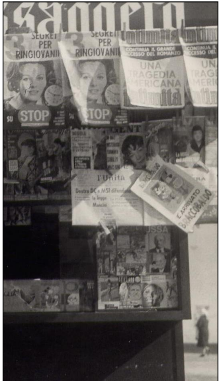
Il giornale "L'unità" in bella vista

C'è un cavallo, un totem, forse un indiano, sicuramente della polvere alzata dal cavallo e poco altro. L'albo è appeso con una molletta, ma una volta tutto era appeso con le mollette alle edicole. Il problema è che non si vede né la molletta né la metà superiore dell'albo, e quello che è visibile è anche in ombra. L'emozione sale: "Un'edicola dei primi anni '60" e quel fumetto, a me noto al punto che anche solo un centimetro sarebbe bastato a farmelo riconoscere, effettivamente un'edizione uscita proprio nel 1960: Tex n° 9, L'ultima battaglia, aut. 478 non censurato.