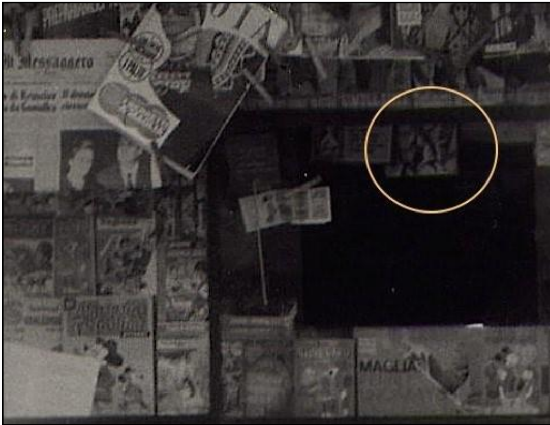
In alto: l'albo di Tex evidenziato nel cerchio