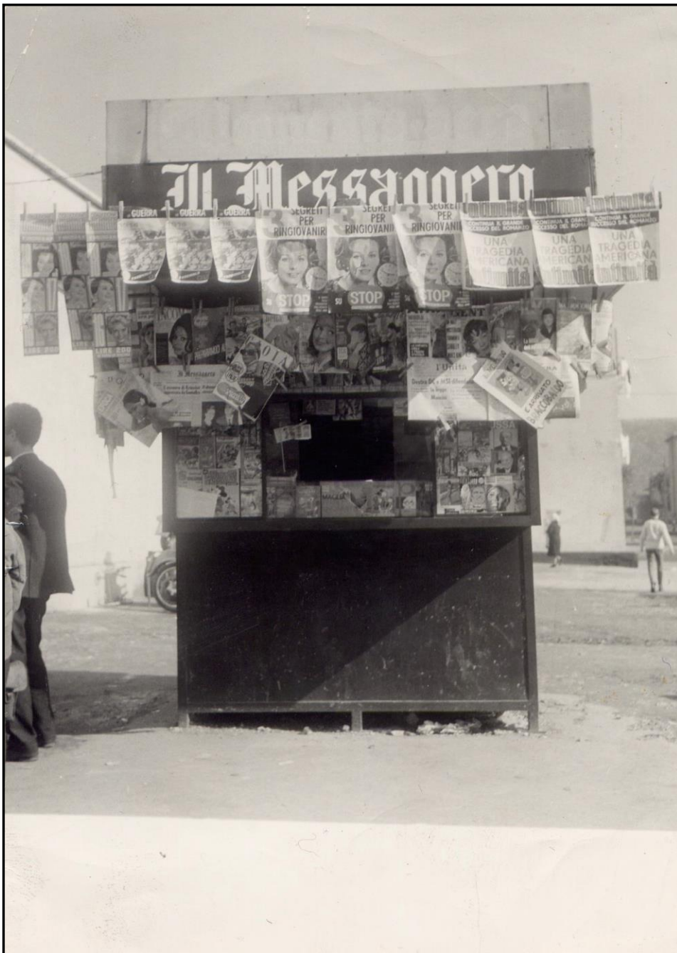
Roma: edicola anni '60 (zona Trullo)