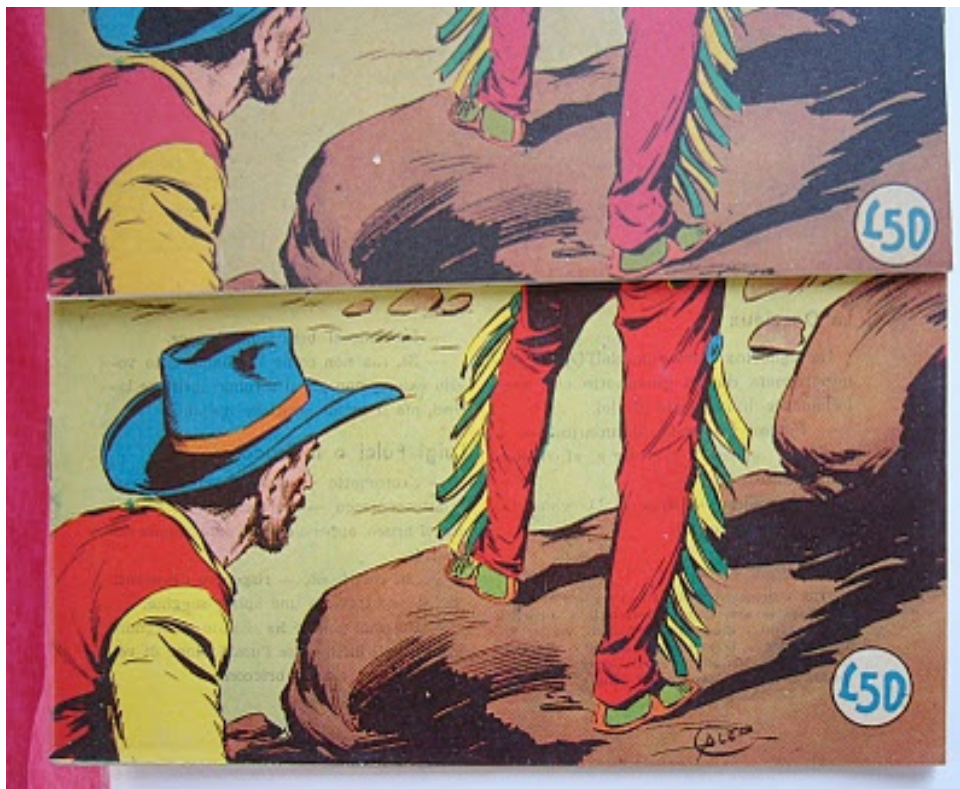
In alto: Differenze nella tonalità dei colori tra l'anastatica (sopra) e l'originale (sotto)

Una delle domande più frequenti che arriva nella posta del nostro sito è quella su come riconoscere un Albo d'Oro in versione anastatica dall'originale. Credo sia già stato detto tutto ed aggiungere informazioni può diventare superfluo se consideriamo che il parametro dirimente rimane quello della numerazione delle pagine assente nelle anastatiche: gli originali hanno infatti la numerazione delle pagine (escluso il n. 1 della prima serie) riscontrabile poi anche negli albi della serie gigante 1/29 che ne sono la raccolta. Esistendo però una gamma di anastatiche differenti l'una dall'altra (quella "ufficiale" rimane di fatto la ristampa della Piacentini, seguita da riproduzioni clandestine che si differenziano non solo per colori ma anche per sostanziali differenze tra vignette e vignette), noi riproduciamo qui un confronto tra un originale e una anastatica (clandestina), mettendo in evidenza il fatto che nell'edizione originale c'è la presenza della testatina di inizio episodio mentre nella anastatica corrispondente è assente (foto sopra).